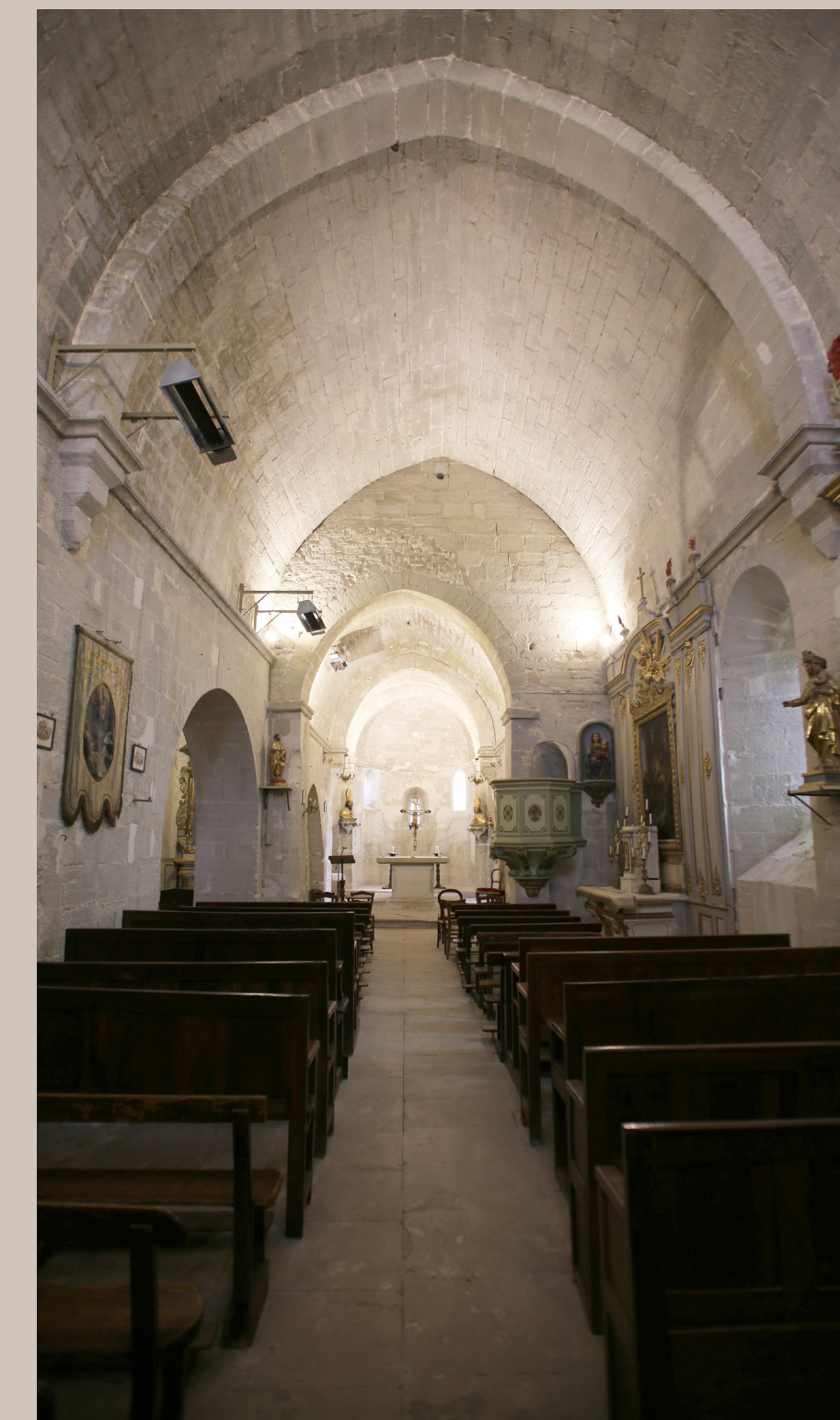
Navata della chiesa romanica di Saint-Trophime

All'inizio del XIII secolo, l'attuale castello non esisteva ancora, ma diverse torri feudali erano ripartite nel paese. Se ne contano cinque, di cui la più rappresentativa si colloca nei pressi della torre campanaria costruita nell'800 accanto all'antica porta d'accesso dei bastioni. Questa torre, edificata tra la fine del XII secolo e l'inizio del XIII secolo, conserva una parte delle sue elevazioni, nonché un corpo di abitazioni risalente al XIII secolo, addossato nella parte posteriore. All'inizio del periodo moderno, questi edifici hanno accolto un frantoio comunale.