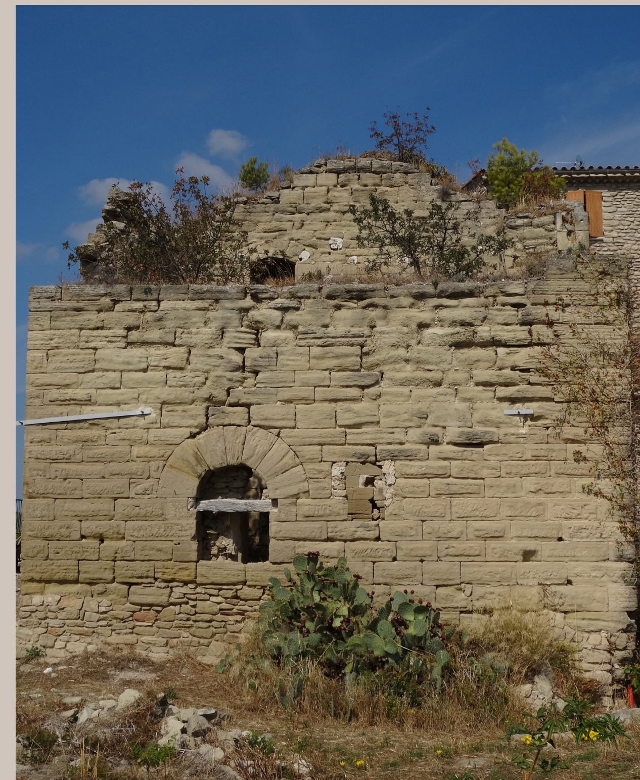
Torre feudale edificata tra la fine del XII e l'inizio del XIII sec.