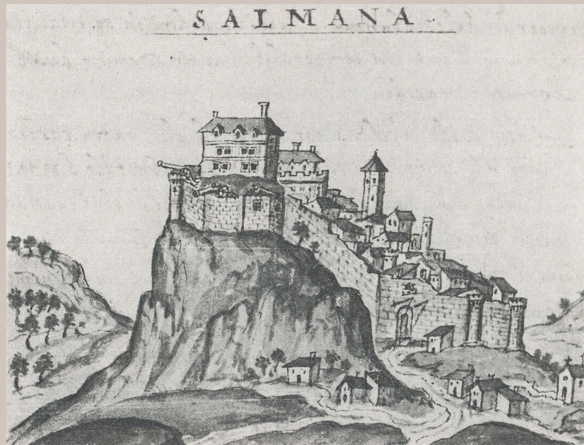
Vista di Saumane alla fine del XVI sec.

Le prime tracce di insediamento nel territorio di Saumane risalgono al Paleolitico e sono attestate dalla presenza dei ripari della Valle di Chinchon. Lo sperone roccioso, anch'esso occupato in tempi molto antichi, offre una posizione strategica che permette il controllo visivo delle aree circostanti.