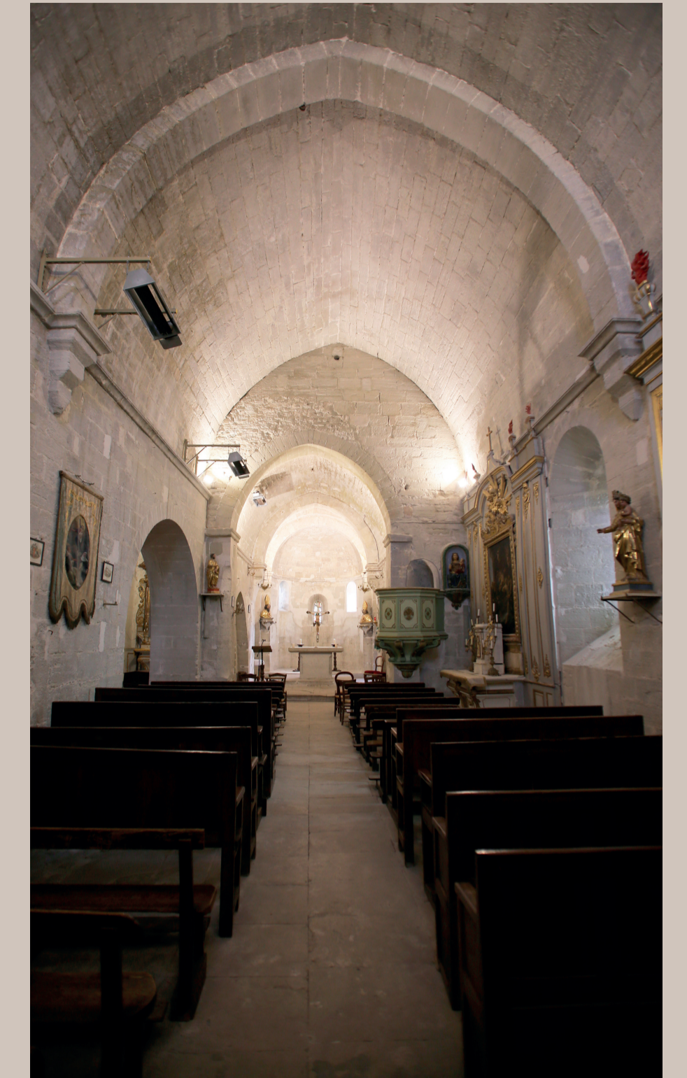
Nef de l'église romane Saint-Trophime

Au début du XIII e siècle, le château actuel n'existait pas mais plusieurs tours seigneuriales se répartissaient dans le village. On en dénombre cinq, dont la plus représentative se situe près du beffroi bâti au XIX e siècle, à proximité de l'ancienne porte d'accès du rempart. Cette tour édifée entre la fin du XII e siècle et le début du XIII e siècle conserve une partie de ses élévations, ainsi qu'un corps de logis du XIII e siècle adossé à l'arrière. Au début de la période moderne, ces bâtiments ont abrité un moulin à huile communal.