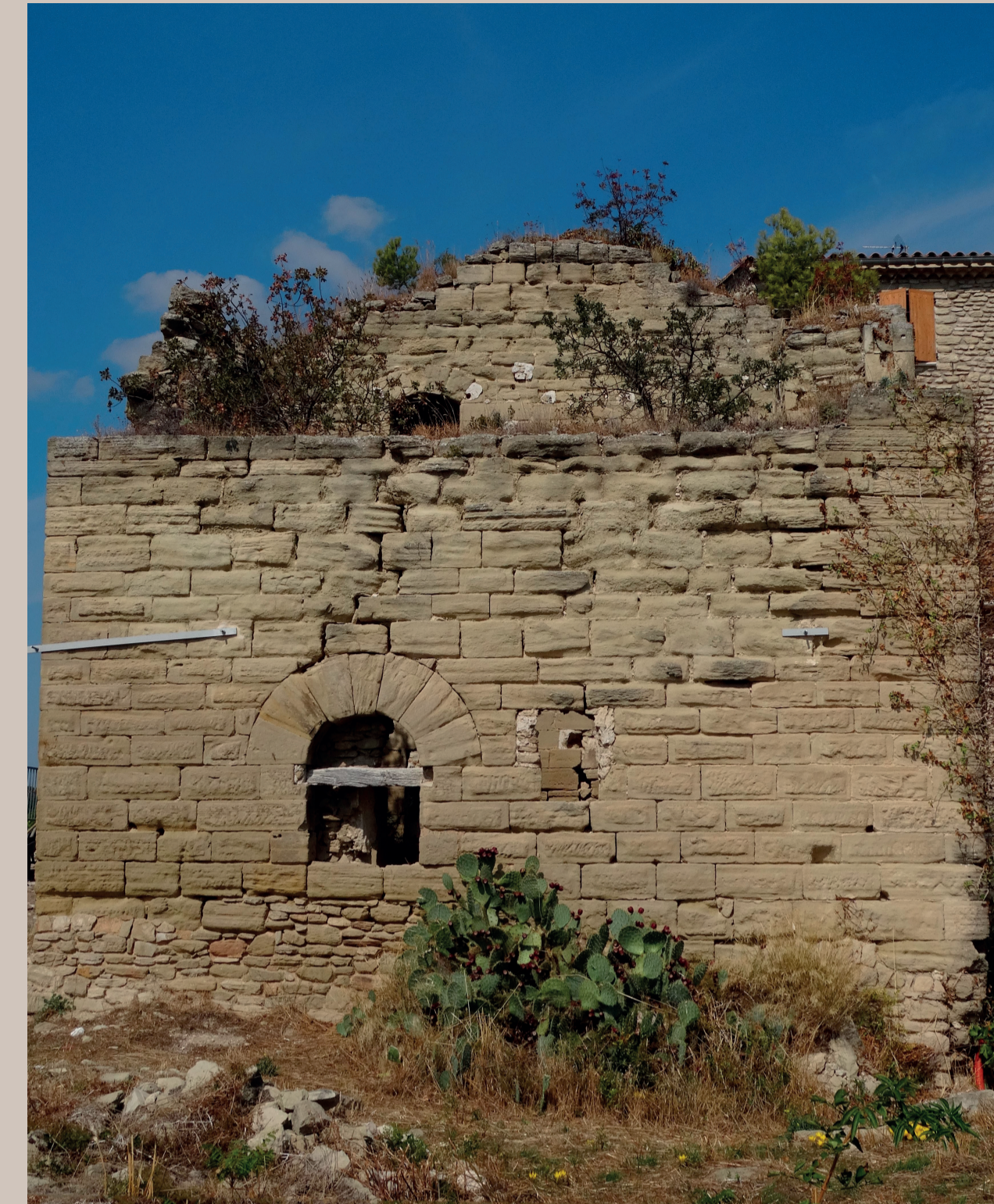
Tour seigneuriale construite fin XII e - début XIII e s.