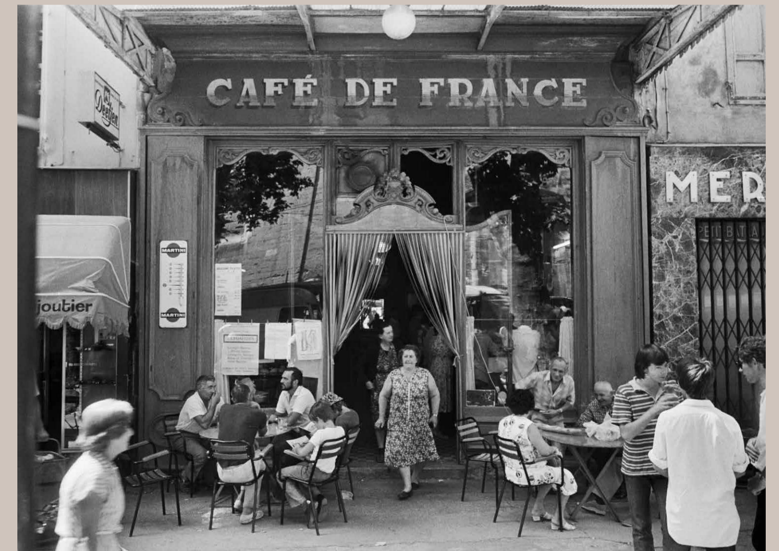
Il Café de France

Willy Ronis (1910-2009), famoso fotografo francese, si trasferisce a L'Isle-sur-la-Sorgue negli anni '70, in una strada vicina alla piazza della chiesa. Durante il suo soggiorno, insegna presso la Scuola di Belle Arti di Avignone e di Aix-en-Provence. Gli si deve tra l'altro una fotografia del Café de France di L'Isle, scattata nel 1979.