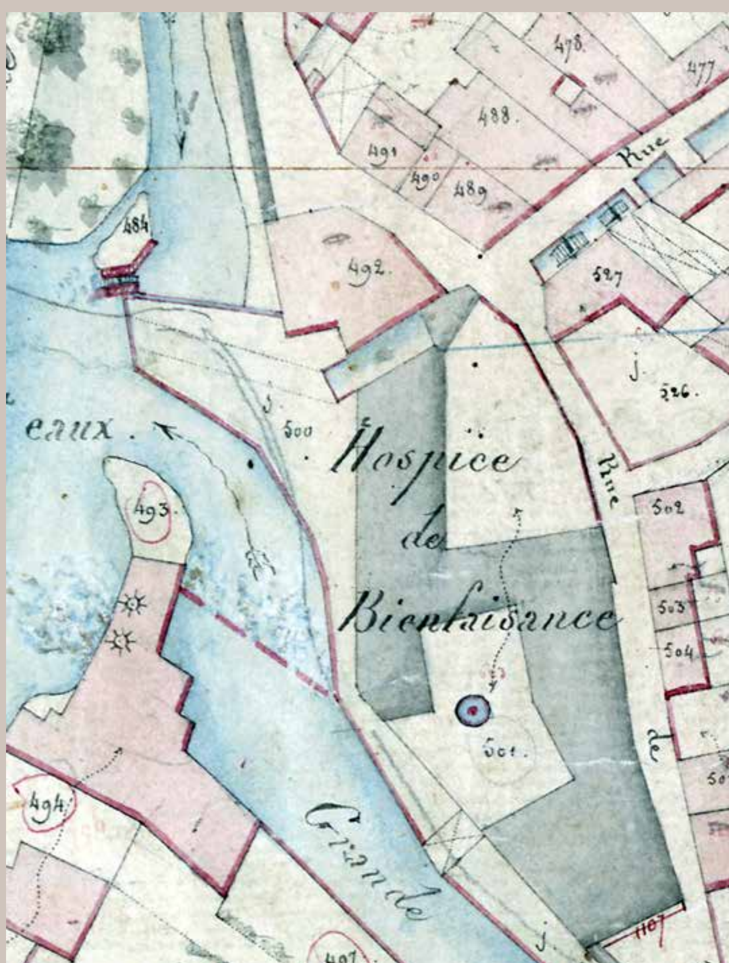
La Charité ou Hospice de Bienfaisance sur le cadastre de 1828

L A CHARITÉ avait pour vocation d'offrir un refuge aux mendiants. À la fin du XVII e siècle, la ville confie les plans de la Charité à l'architecte avignonnais Pierre Mignard. Ce projet ambitieux prévoyait la construction d'un vaste ensemble à quatre corps de bâtiment avec deux grandes cours. Débutée en 1681, la réalisation se limite au final à une seule aile implantée perpendiculairement à la rue.