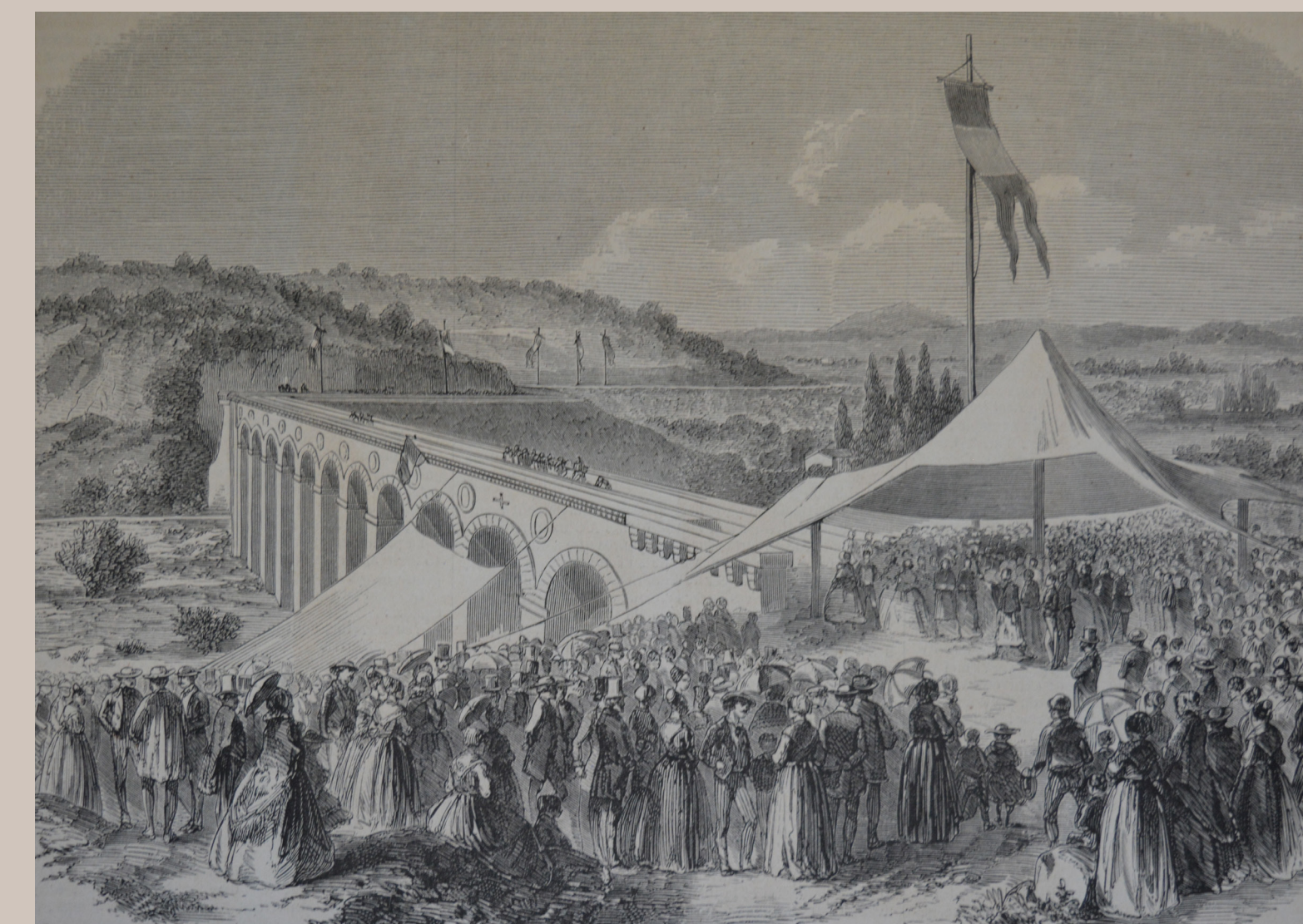
L'inaugurazione dell'acquedotto di Galas in presenza dell'imperatrice Eugenia. Disegno di J.B. Laurens sulla rivista "L'Illustration" del 25 luglio 1857 © Biblioteca-museo Inguimbertaine, Carpentras

Questo quartiere attraversato dalla Sorgue era un'area agricola, piantata in particolare con vigneti. Le monache, che hanno il diritto di sfruttare l'acqua del fiume, fanno costruire dei mulini che saranno venduti in seguito. Alla fine del XVII secolo, uno di questi mulini diventa una cartiera. All'inizio del '800, esisteva anche una fabbrica per la lavorazione della robbia, per trasformare le radici di questo vegetale in colorante rosso, che divenne anch'essa una cartiera alla fine del XIX secolo.