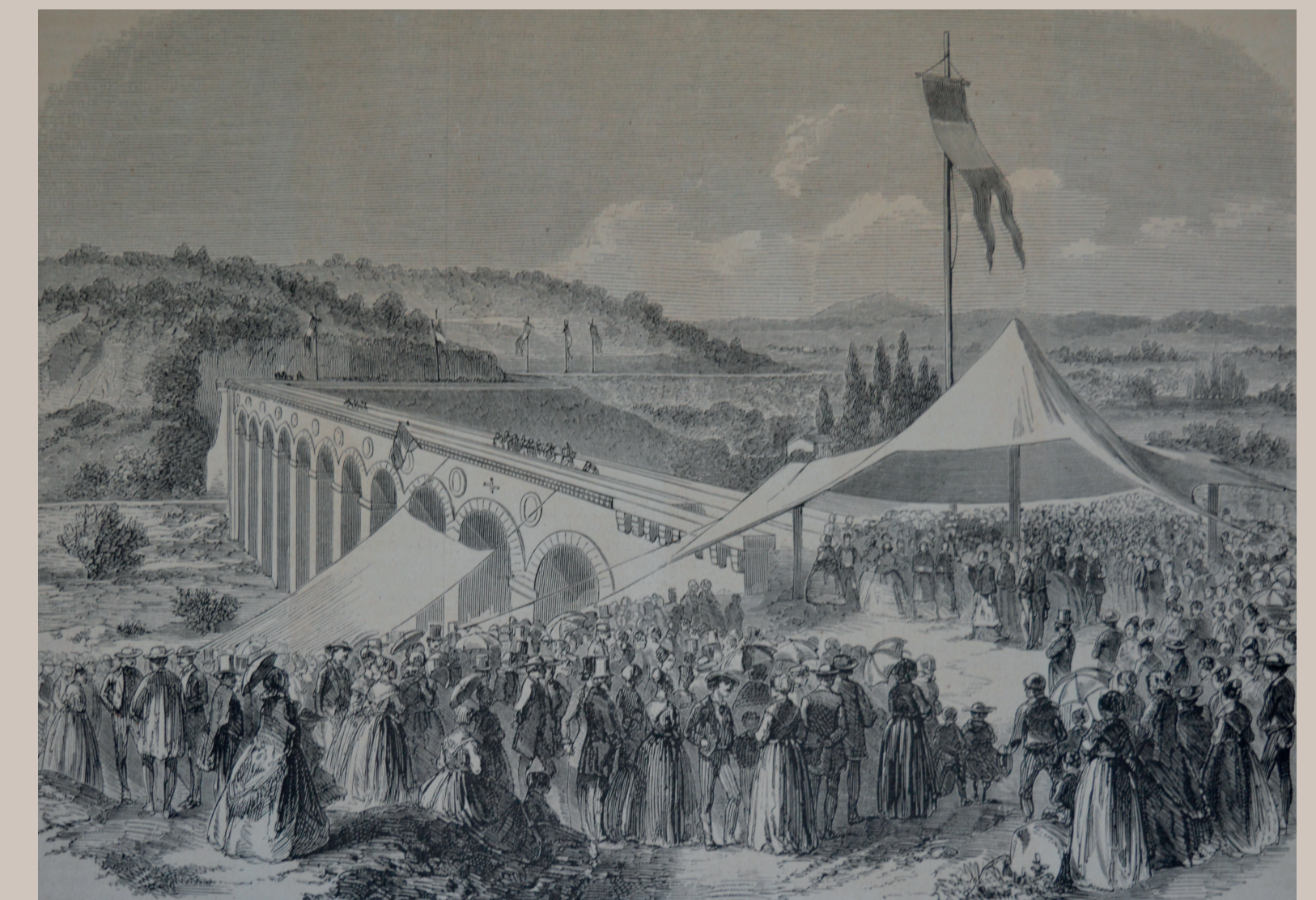
L'inauguration de l'aqueduc de Galas en présence de l'impératrice Eugénie. Dessin de J.B. Laurens dans la revue « L'Illustration » du 25 juillet 1857 © Bibliothèque-musée Inguimbertaine, Carpentras

Ce quartier où coule la Sorgue était une zone agricole, plantée notamment en vigne. Les religieuses ont le droit d'exploiter l'eau de la rivière et font bâtir des moulins, qui sont par la suite vendus. À la fin du XVII e siècle, l'un d'eux devient une papeterie. Au début du XIX e siècle, il y existe aussi une fabrique de garance, afin de transformer les racines de ce végétal en colorant rouge, qui devient également une papeterie à la fin du XIX e siècle.