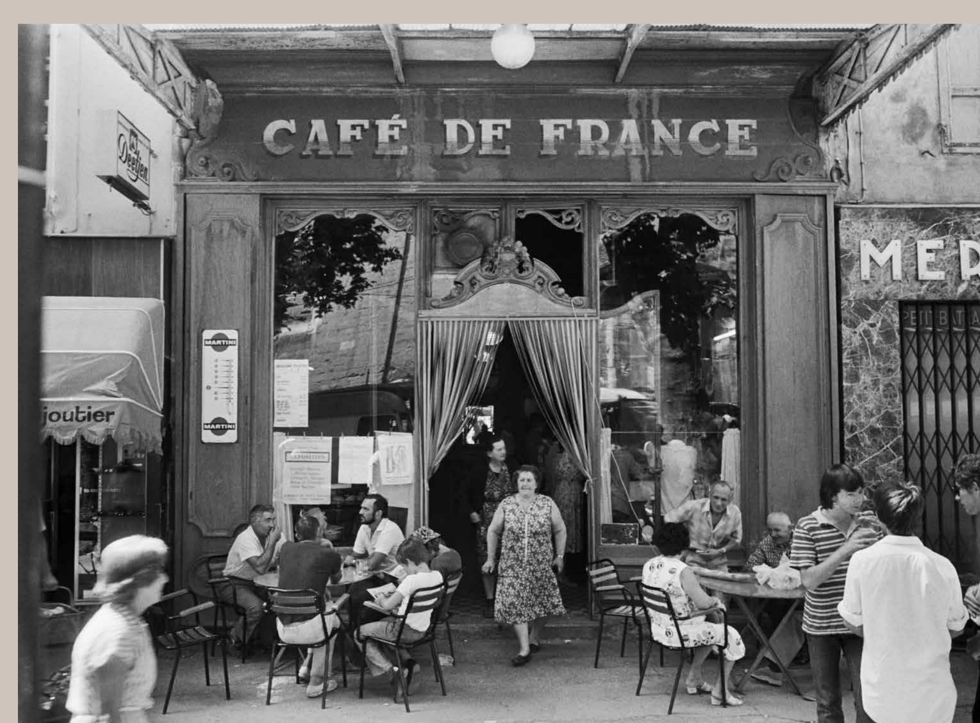
Le « Café de France » par Willy Ronis © Ministère de la Culture. Médiathèque de l'architecture et du patrimoine. Donation Willy Ronis. Dist. RMN-GP

Willy Ronis (1910-2009), célèbre photographe français, s'installe dans les années 1970 à L'Isle-sur-la-Sorgue, dans une rue près de la place de l'église. Pendant son séjour, il donna des cours à l'École des Beaux-Arts d'Avignon et à Aix-en-Provence. On lui doit entre autres une photo du café de France de L'Isle prise en 1979.